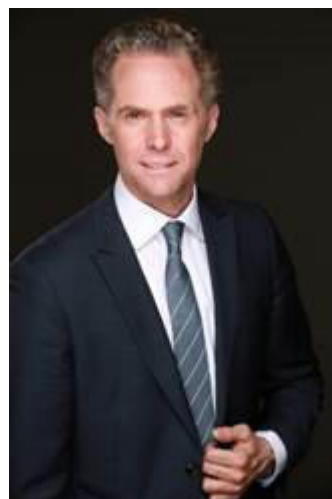
Ihr Gunter Burgbacher und das gesamte

Börsennotierte Beteiligungsunternehmen in Form von Beteiligungsgesellschaften, Holdings und Mischkonzernen sind nach wie vor eine noch unterrepräsentierte Anlageklasse. Das aktuell 40 Unternehmen umfassende Portfolio des Aktienfonds für Beteiligungsunternehmen bietet Investoren nachhaltiges Outperformancepotenzial aufgrund von 40 Profis, die in Summe über 5.000 indirekte Beteiligungen (Investments und Akquisitionen) halten und Werte schaffen - Investieren Sie mit uns gemeinsam in die Warren Buffetts der Welt!